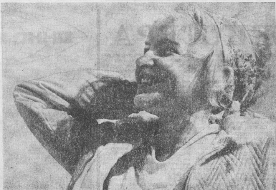
Под таким девизом проходил фотоконкурс, объявленный обкомом профсоюза работников просвещения, высшей школы и научных учреждений весной юбилейного года. Присланные на конкурс фотографии рассказывают о туристических походах, в которых побывали педагоги, о достижениях Кузбасса, о его людях, живописной природе. Жюри конкурса лучшими фотографиями признало снимки Леонида Романовича Сен-