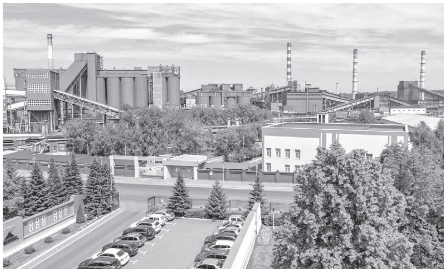
■ Панорама ПАО «Кокс».