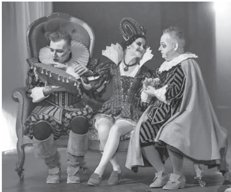
■ Сцена из спектакля «Призрак замка Кентервиль».

строен скептически. Но, очевидно, пьеса ждала, пока станет мюзиклом!» – рассказала Вероника Козоровицкая, режиссёр Санкт-Петербургского государственного музыкально-драматического театра «Буфф».