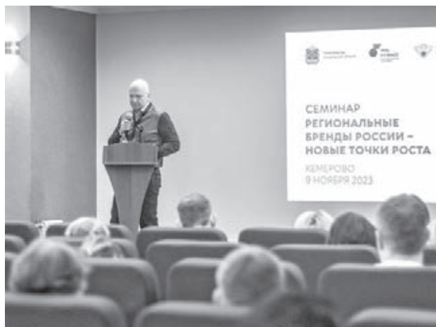
■ Фото Александра Денисова.

На днях в Кемерове научно-образовательный центр «Кузбасс» совместно с Федеральным институтом промышленной собственности и Роспатентом провёл обучающий семинар, в котором приняли участие представители вузов, НИИ, регионального бизнес-сообщества и представители администраций муниципальных образований Кузбасса.