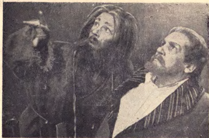
«Егор Булычев и другие» Пропотей — Иушин Г. М., Булычев — Легков Г. Л.