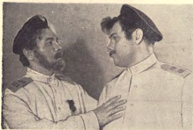
«Порт Артур» Блохин — Давыдов В. Е., Тере- решкин — Лихман В. А.